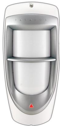
Figure / Figura 1

Printed in Canada - 04/2012 PARADOX.COM DG85-T110